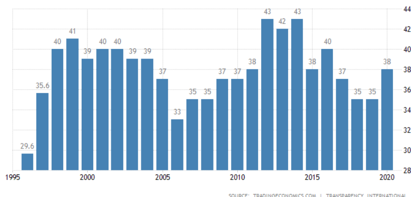
Gráfico 2 - Percepção da corrupção no Brasil

Entretanto, a autora desta dissertação entende que a eventual imprecisão dos dados não desabona os estudos científicos que indicam a relação intrínseca entre corrupção e a prestação de serviços públicos de baixa qualidade, o agravamento da desigualdade de renda e gargalos no crescimento econômico dos países mais pobres. 36