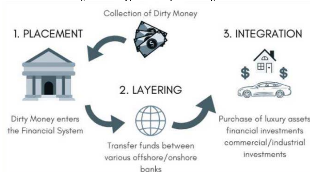
Figura 1 – A typical money laundering scheme