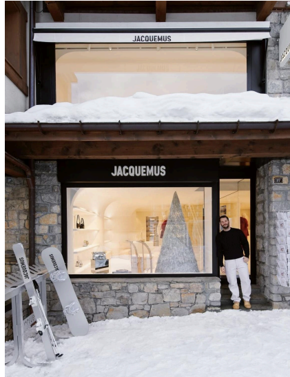
Figura 07: Pop Up Store Jacquemus