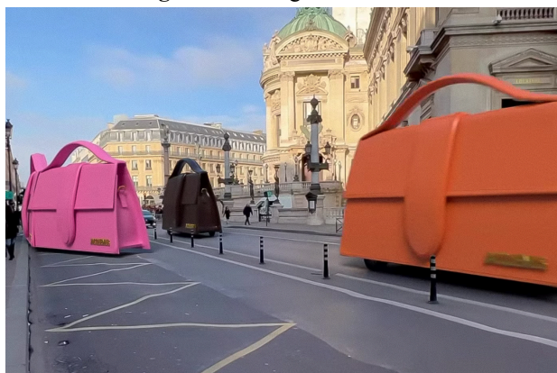
Figura 06: Bangs on Wheels

Conforme destacado por Lima (2023), a Jacquemus adotou o uso de CGI, ou Computer-Generated Imagery 1 . A aplicação de inteligência artificial possibilita a criação de campanhas 3D realistas, as quais têm impactado as discussões nas redes sociais. Exemplificadas por iniciativas como "Bangs on Wheels" e o lançamento da bolsa inflável mais recente, essas campanhas evidenciam o potencial do CGI em estimular a intenção de compra, promover o compartilhamento de conteúdo e expandir o alcance da marca.