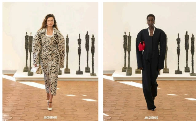
Figura 03: Les Sculptures

Além disso, a marca lançou a coleção de verão intitulada "Les Sculptures", que contou com a presença de convidados como Gigi Hadid, Julia Roberts, Kylie Jenner e Daniel Caesar, o que evidenciou a marca no cenário da moda contemporânea e a sua capacidade de atrair figuras influentes da indústria. Observa-se que este evento destacou também a sua estratégia de posicionamento no mercado, ao associar suas criações a personalidades reconhecidas.