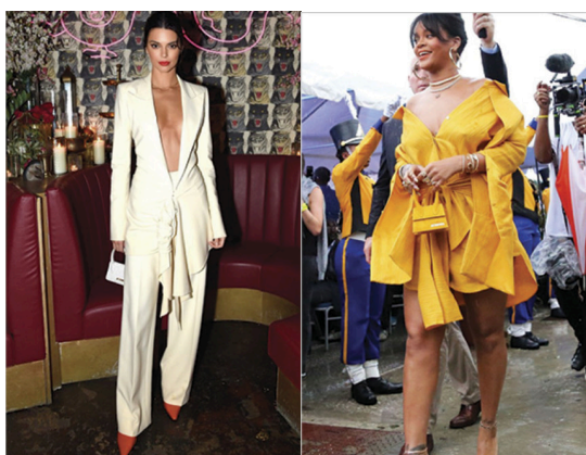
Figura 05: Kendall Jenner e Rihanna com a bolsa Le Chiquito